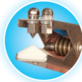
Punte al carburo di tungsteno