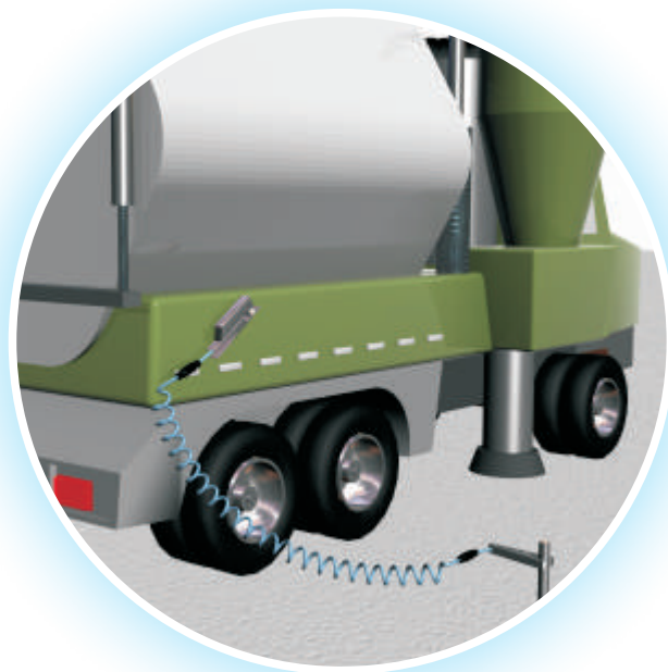
Collegamento equipotenziale di un camion di aspirazione all'asta di messa a terra.