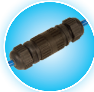
Connettore Rapido in Linea